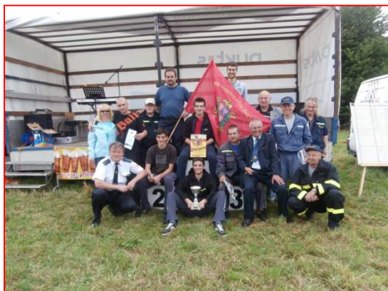
Soutěž Železná u Berouna 2014