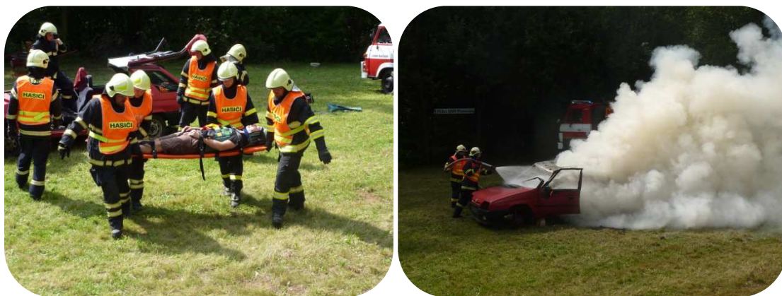
Vyproštění osoby z automobilu

Předvedlo se několik ukázek činnosti hasičů, a to vystoupení naší mládeže, která předvedla požární útok. Dále pak JSDH Račice předvedla vyproštění osoby z osobního automobilu a následně po zapálení připraveného vraku auta jednotka z Drnovic předvedla hašení vozu. Poté přišla na řadu ukázka staré stříkačky, tzv. hydroforu, u které jsme prověřili nejen její funkčnost, ale i naši zdatnost. I po více než 110 letech je pořád funkční a „připravena na zásah 😊“.