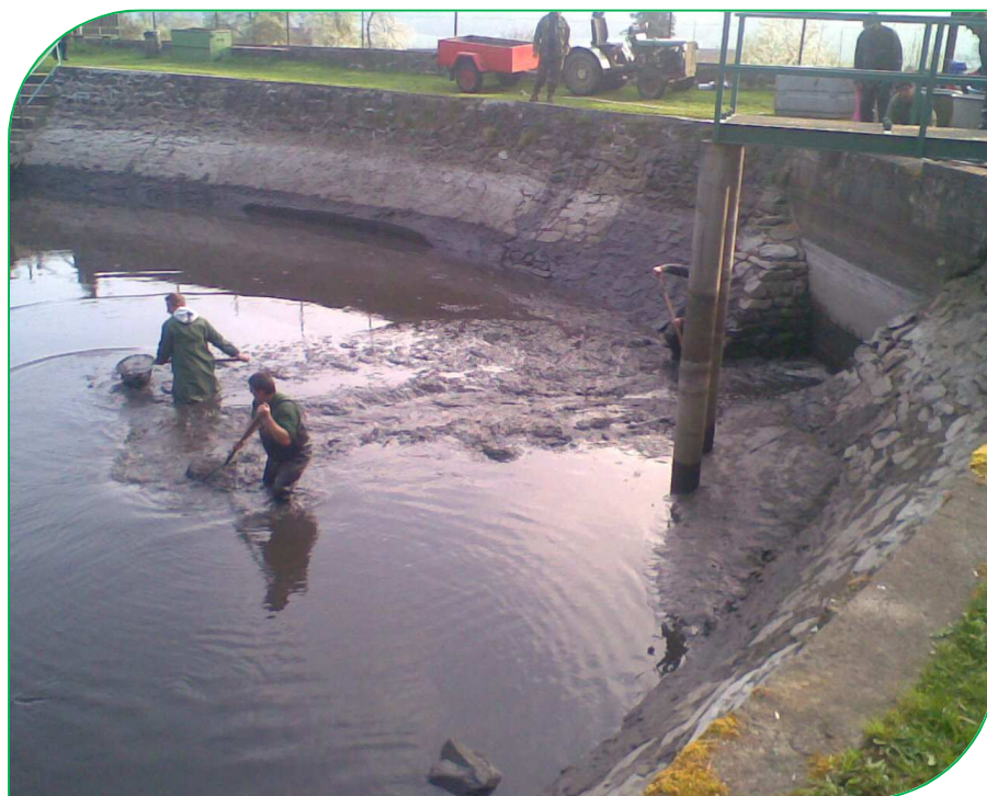
Výlov rybníčka pod zámekem