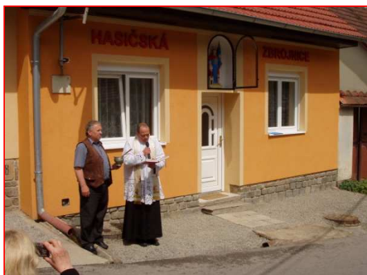
Svěcení sochy sv. Floriána