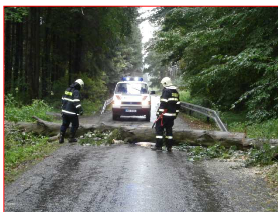
Odstraňování stromu z vozovky