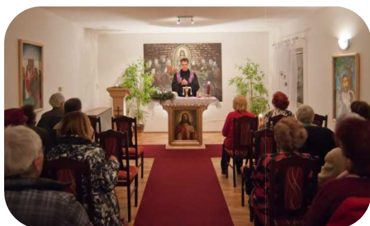
Sbor Páně v Račicích

Jistý člověk jménem Jan považoval Vánoce za zcela bezvýznamný svátek. Večer 24. prosince měl za nejsmutnější v roce, protože různí lidé si tehdy uvědomují, jak osamělí jsou, nebo si připomínají milovanou osobu, jež toho roku zemřela. Honza byl dobrý člověk.