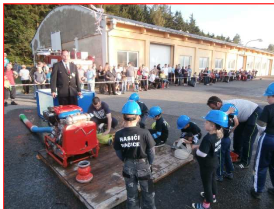
Noční soutěž Senetářov 2014 – mladší a přípravka