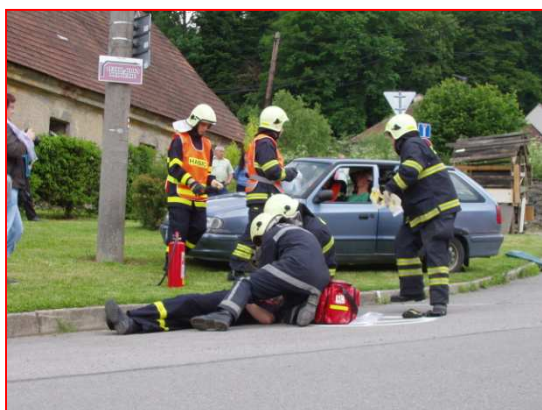
Ukázka činnosti JSDH Račice